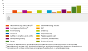
Figuur 3.2.2b. Ontvangen meldingen Veilig Thuis naar type melder 1) , 1 st halfjaar 2019